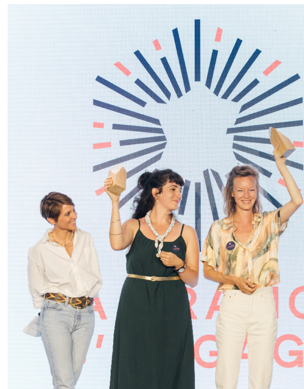
Festival de La France s'engage 2022

Pour assurer le financement et l'accompagnement des lauréats labellisés, la Fondation s'appuie sur l'implication forte de ses entreprises mécènes (TotalEnergies, BNP Paribas, Andros, Artémis, Engie, Capgemini, Malakoff Humanis, VYV, Groupe La Poste, AG2R La Mondiale, Kearney, KPMG, Havas Paris, Accenture, l'AFD et la Banque des Territoires).