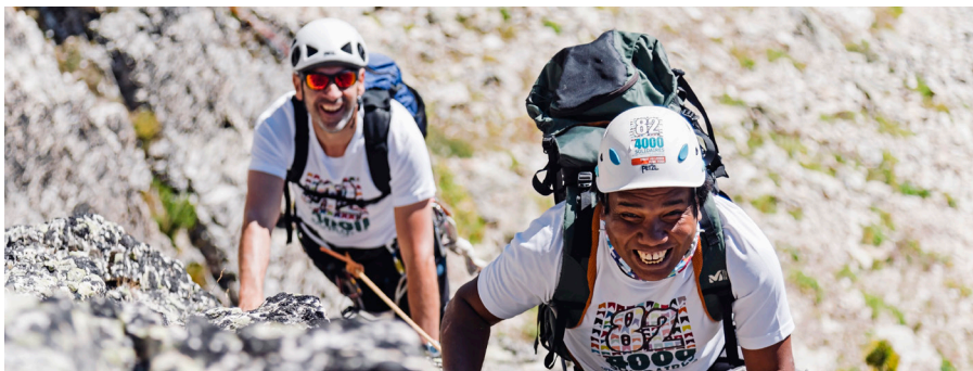
82-4000 Solidaires, lauréat 2022