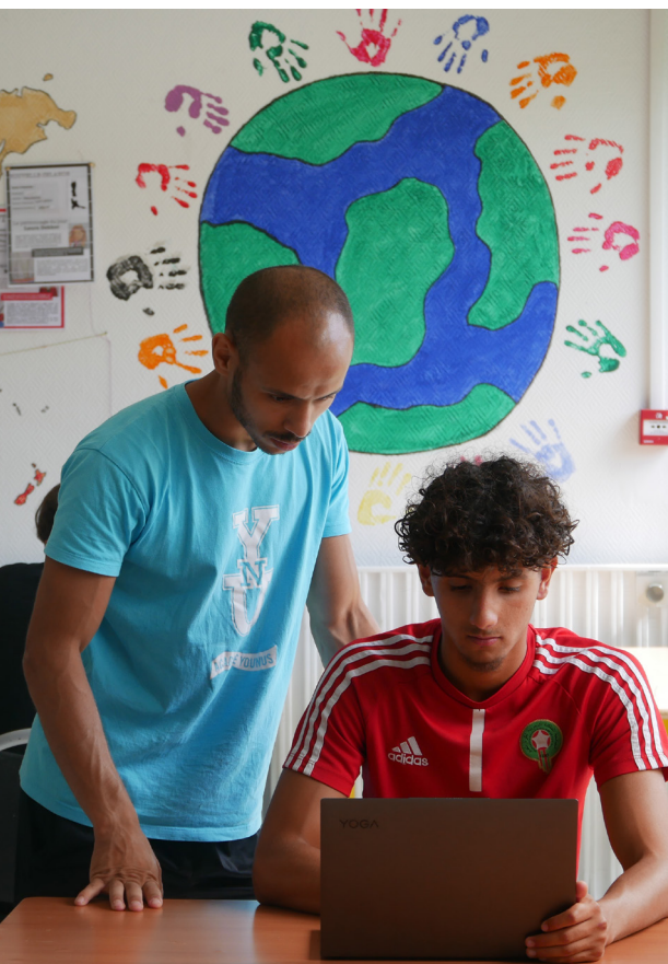
Académie Younus, lauréat 2022

La structure doit avoir un budget supérieur à 80 000 € pour postuler. Il s'agit des produits d'exploitation 2021 ou du dernier exercice comptable approuvé (chiffre d'affaires pour les entreprises ESUS et somme des budgets pour les coalitions). Les contributions volontaires en nature ne sont pas comprises dans ce calcul. Ce seuil est désormais le même pour les structures d'outre-mer.