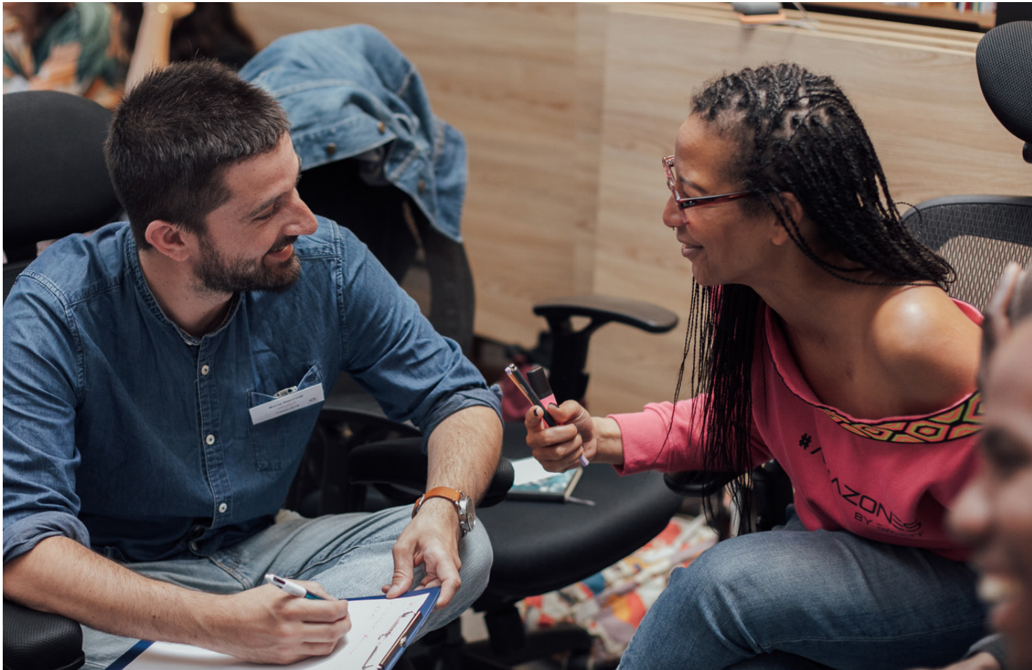
Bootcamp des finalistes 2022