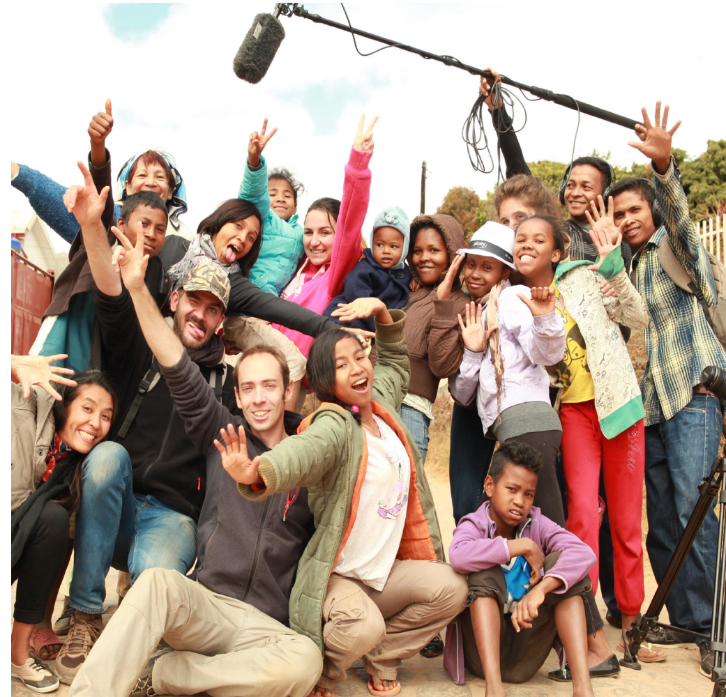
Choisis ta planète, lauréat 2022

57% des projets avaient un budget annuel compris entre 80 000 € et 500 000 €.