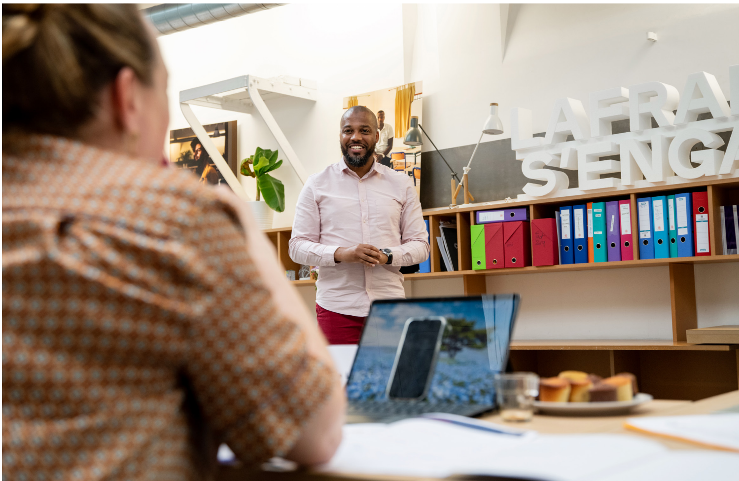
Jury final 2022