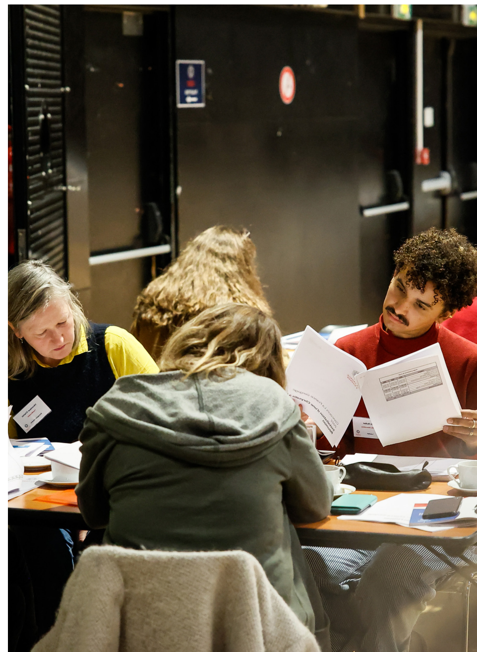
Second jury de sélection 2022

Moyens mis en œuvre pour augmenter le nombre de bénéficiaires et ainsi élargir son public cible sur de nouveaux territoires.