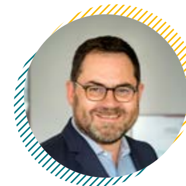
Jérôme SADDIER Président d'ESS France

Dès lors, comment assurer un co-portage efficient à l'échelle territoriale de l'intérêt général ? Quelle coalition entre l'ESS et les services publics locaux ? Comment assurer l'indépendance des structures de l'ESS pour garantir leur puissance créatrice et collective ? Telles sont les interrogations auxquelles nous souhaitons apporter des réponses via ce livret.